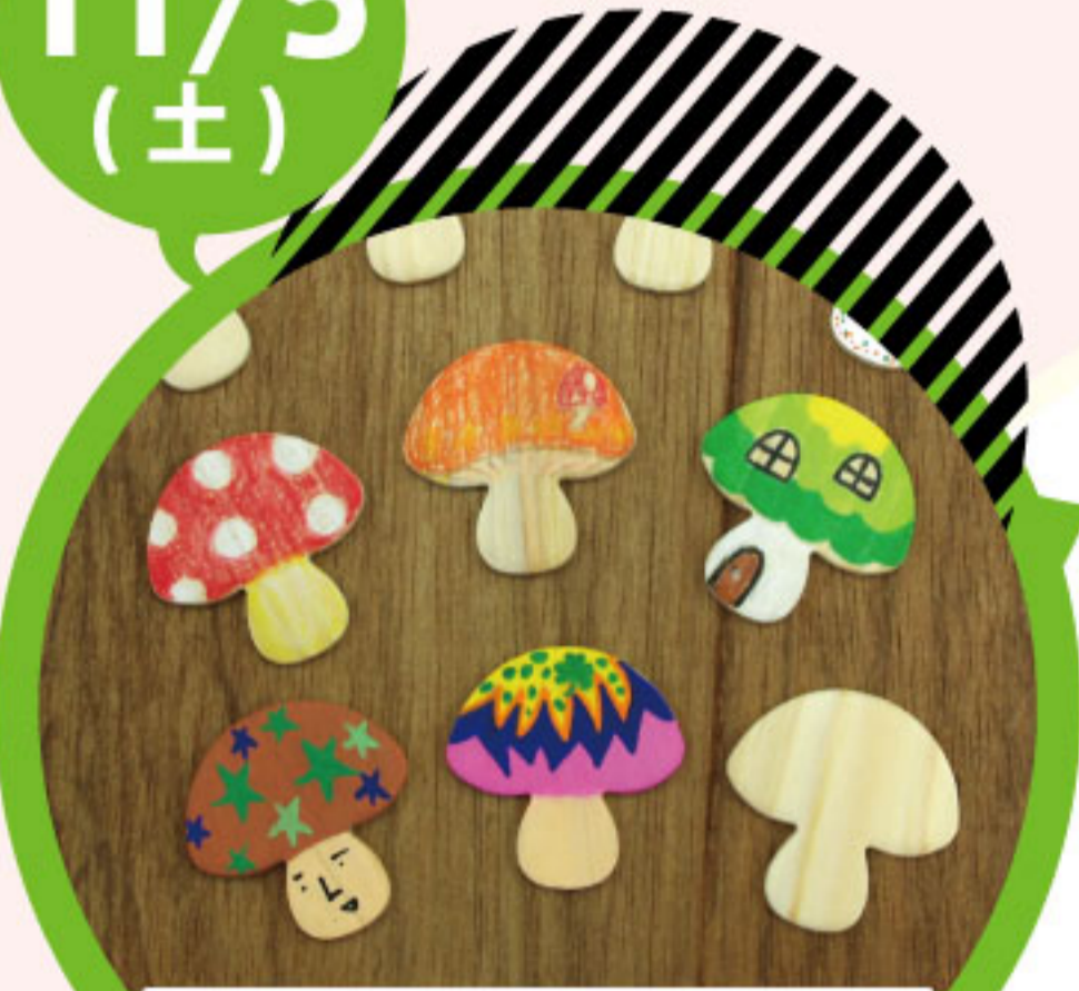
キノコの間伐材バッジ