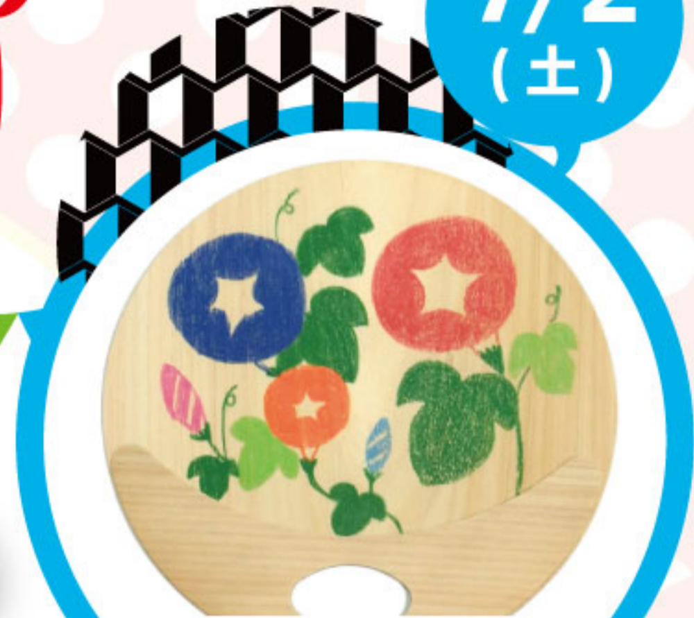
国産ヒノキの 間伐材うちわ