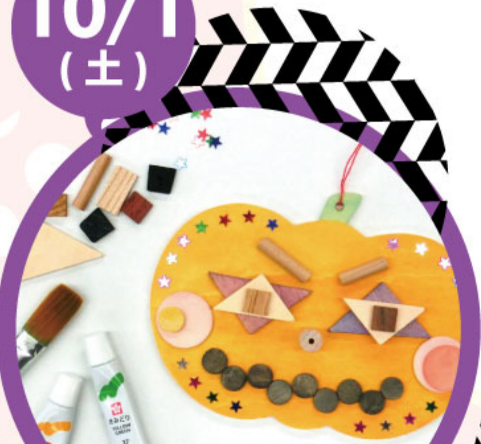
ハロウィン かぼちゃのオーナメント